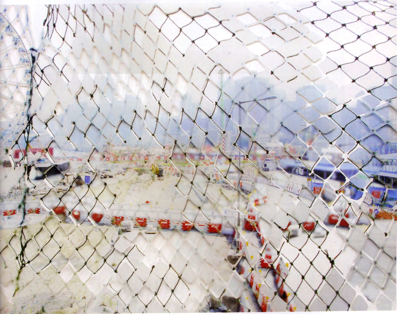
Double Meaning, 2015 Photographic collage, mounted on acrylic and paper 88 x 120 cm