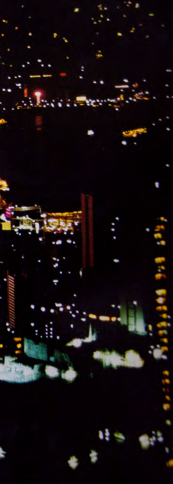
Endless Night (detail), 2015 Cut-out photograph, mounted on aluminum 88 x 120 cm

"VOID" 於英文中可指無用的、沒有的、空虛的，也可指空隙與空間。對於功利主義的社會來說，「空」就等於甚麼都沒有，是失敗的表徵。但對池田眾來說，就要有「空」才能感受、才能發展、才能看見。這個名為《VOID》的攝影展，內裏放着一張又一張於香港拍攝的藝術作品，把他對香港的都市印象托裱於畫框之中。