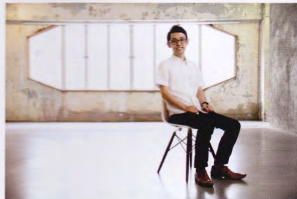
日本藝術家池田眾

看官可悉隨尊便地為這個展覽用自己的感覺去下定義，因為池田眾就是想為大家帶來多元思想的空間，若然你能與同行友人各自對展覽中的藝術品存有不同的見解，又能從對方身上獲得新的看法時，相信這就是對他最大的鼓舞。 ▢