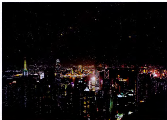
Endless Night , 2015 Cut-out photograph, mounted on aluminum 88 x 120 cm

於香港這片土地，任誰都會認為自己是一股建設力量，指罵不認同自己意見的為破壞力量，但這種看似兩極的元素，真的能容易地分得清或分得開嗎？