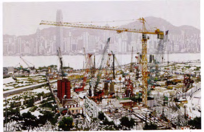
Constructive Destruction, 2015 Cut-out photograph, mounted on paper 80 x 110 cm